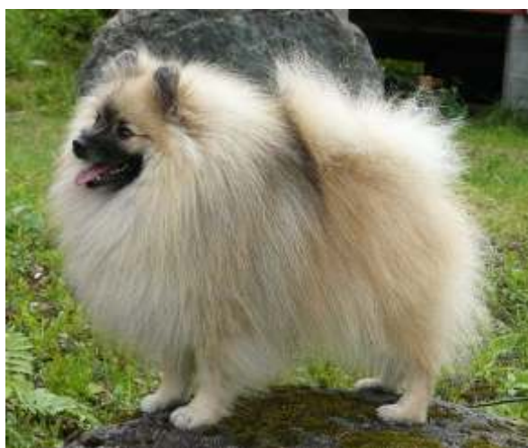
Kerma-soopeleita, joissa vain vähän mustaa soopeliväriä, aivan hyväksytyjä