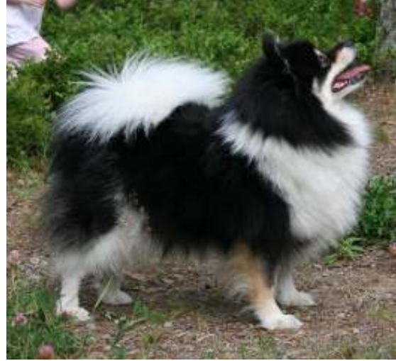
Pääväri black&tan jota on liikaa, virhe

Alla lueteltuna värivirheitä, joita saksanpystykorvissa esiintyy.