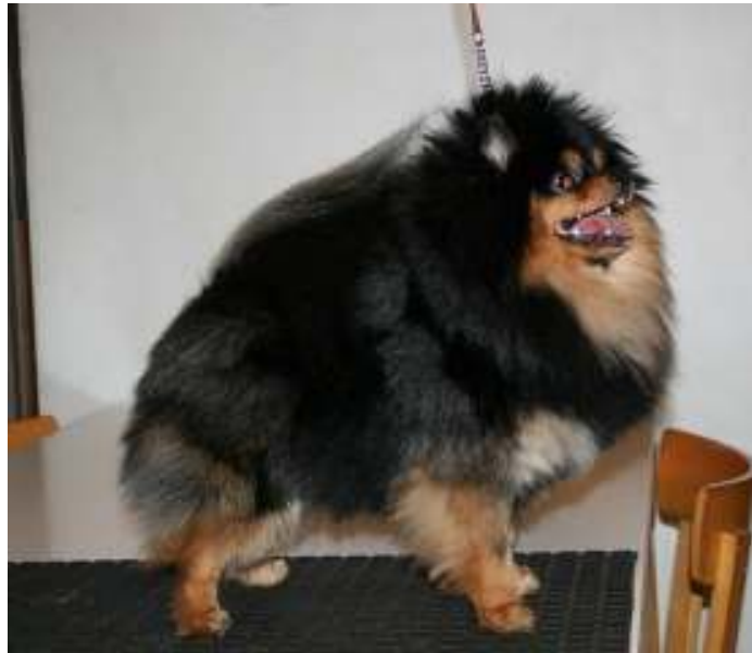
Mustat osiot tulisi olla puhtaammat, virhe