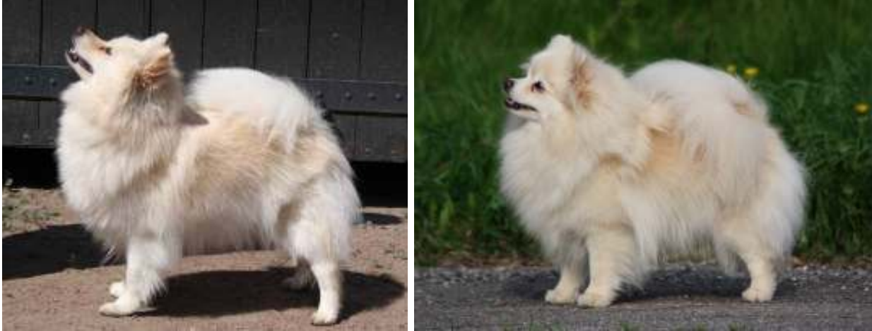
Kauniit cremet värit

Osa koirista ei ole kermoja eikä valkoisia, tällöin luetaan vakavaksi virheeksi. Kermanvärisillä kirsupigmentti on usein haalistunut ja se sallitaan, mutta mustaa pigmenttiä täytyy kuitenkin löytyä silmäluomista, huulista ja kirsun reunoilta.