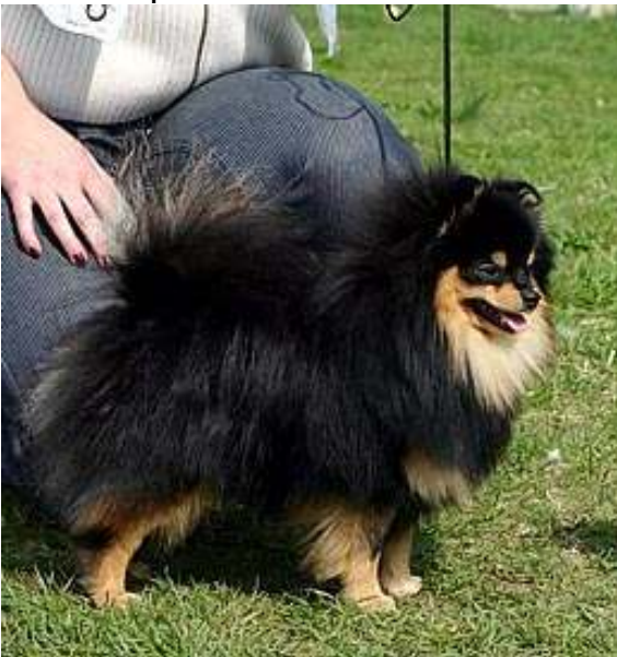
Sopivankokoiset merkit, riittävän punertavat.

Yleisin virhe tässä värissä on, että merkit ovat liian niukat ja nokiset tai vaaleat (kermanväriset). Vaaleat merkit ovat virhe, mutta puutteelliset tai nokiset merkit ovat vakavampi virhe.