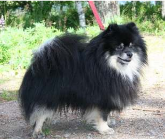
Vaaleat merkit, virhe