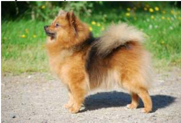
Kaunis oranssi-soopeli väri

Jos yleisväri on suttuinen ja synkkä tai mustavoittoinen niin se on vakava virhe. Maskia voi ja saa esiintyä.