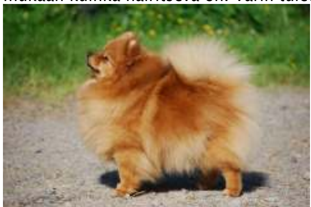
Kaunis kirkas oranssi

Oranssi voi olla tummempi tai vaaleampi. Häntä, housukarvat sekä kaulus ja valjaskuvio saavat erottua. Joskus esiintyy urajiroa ja se katsotaan virheeksi sen mukaan kuinka häiritsevä on. Väriin tulee olla kirkas ja kiiltävä.