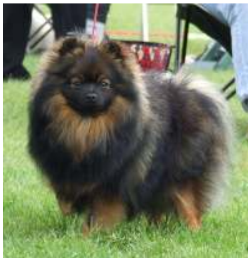
Liian mustavoittoisia ja suttuisia värejä, luetaan jo vakavaksi virheeksi