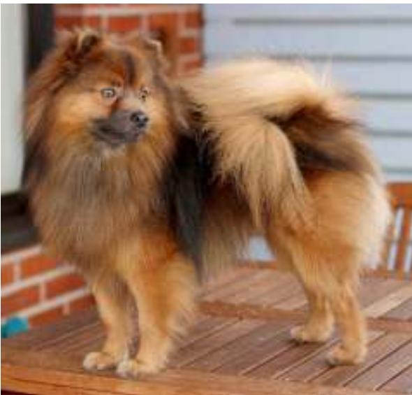
Sininen-soopeli (huomaa pigmentti ja silmien väri)