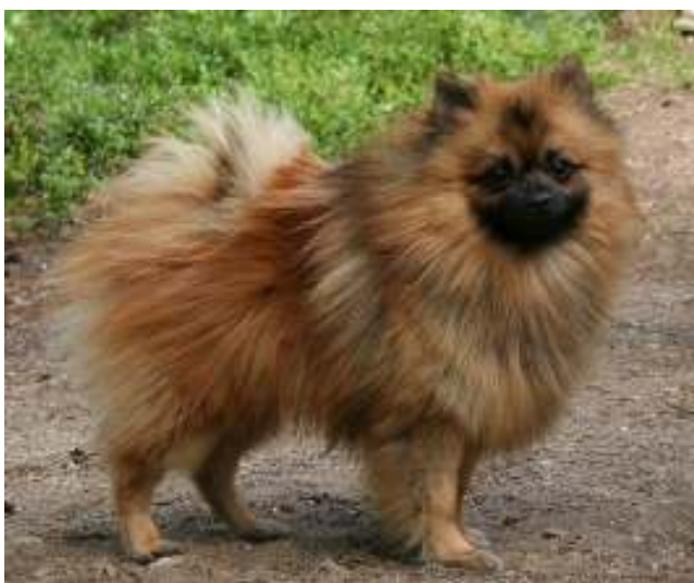
Oranssi-soopeleita joissa niukasti soopelia, aivan hyväksytyjä