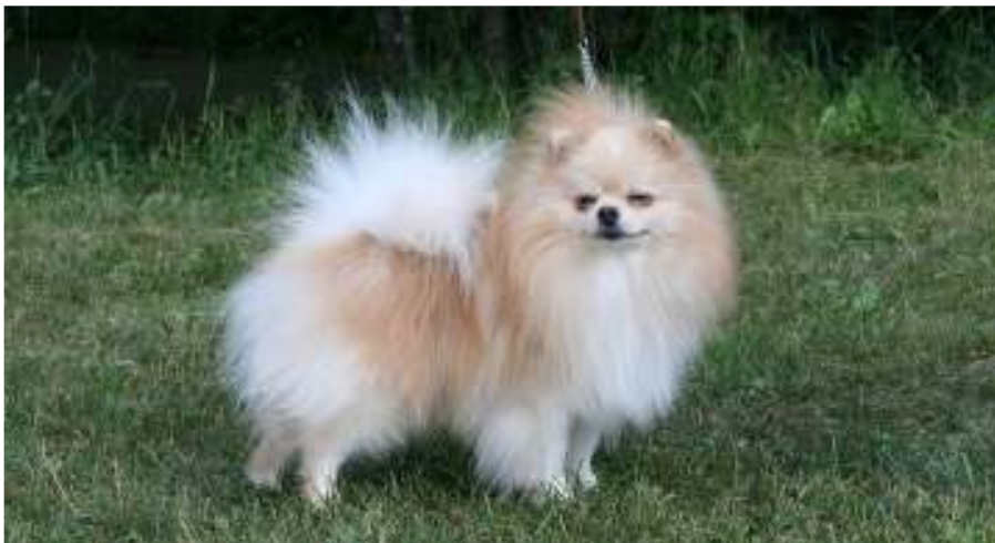
Tummempi kermanväri, aivan hyväksytty

Harmaa: Hopeanharmaa mustin karvankärjin. Kuono ja korvat ovat tummat, kummankin silmän ympärillä on selvä vinosti silmän ulkokulmasta korvan uloimpaan kiinnityskohtaan kulkeva ohut musta viiva, ns. silmälasit; lyhyet, mutta ilmeikkäät kulmakarvat saavat aikaan selvästi erottuvan rajauksen ja varjostuksen. Harja ja lapoja myötäilevät värimerkit ovat vaaleat. Raajat ovat hopeanharmaat ilman mustia merkkejä kyynärpään tai kintereen alapuolella, lukuunottamatta vaaleampaa juovitusta varpaissa. Musta hännänpää. Hännän alapuoli ja housukarvat ovat vaalean hopeanharmaat.