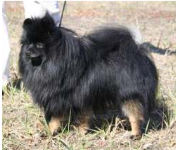
Hyvin puutteelliset merkit, jo vakava virhe