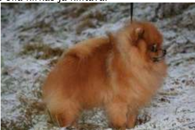
Tummempi, hieman mattainen oranssi