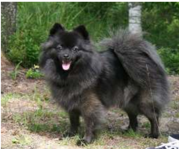
Sävyttynyt musta (tässä laajuudessa vakava virhe)