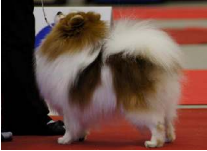
Kaunis oranssi-valkoinen väri

Joskus esiintyy koiria, joilla valkoinen ei ole hallitsevana pohjaväriä tai valkoisessa osassa on pilkutusta, nämä ovat virheitä sen mukaan miten paljon ne häiritsevät. Jos koiralla on valkoista vain esim. rinnassa ja raajoissa, ei se tee koirasta kirjavaa.