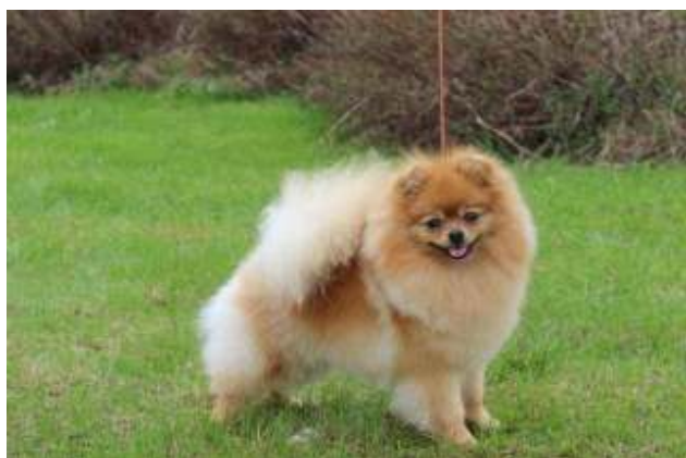
Vaalea oranssi, pommin väri hieman vaalenee kun päällikarvaa trimmataan pois.